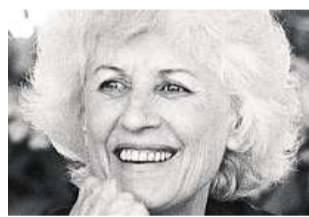
První žena prezidenta Václava Havla. Zemřela v roce 1996.